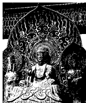
法隆寺の 釈迦三尊像