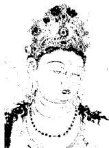
法隆寺 金堂の壁画