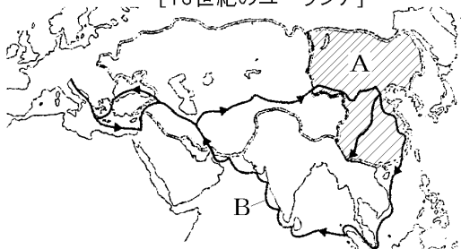
[13世紀のユーラシア]