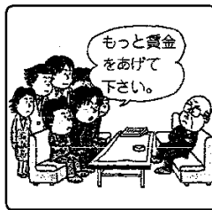
② ( ) 権