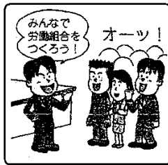
① ( ) 権