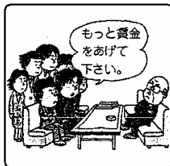
② ( )権